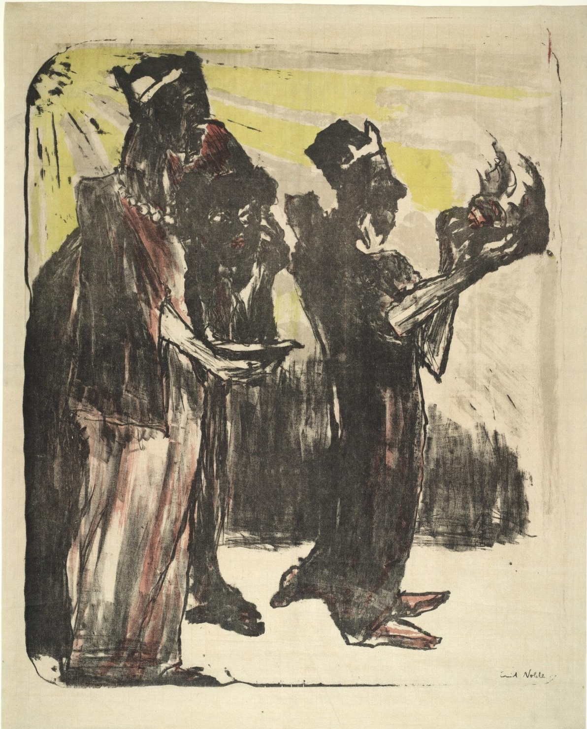
Die heiligen drei Könige (litho) door Emil Nolde (afb. MoMA)

Informatieblad van de oud-katholieke parochie Amersfoort